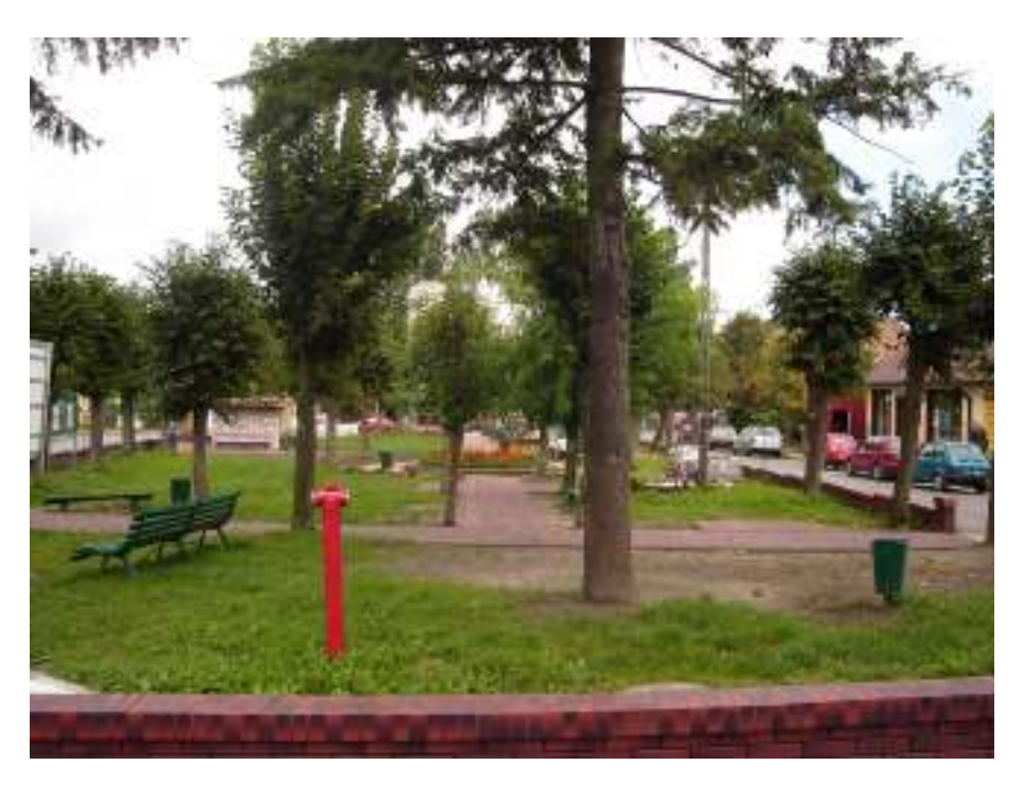
Foto: Park w centrum Wielgomłyn.

Rynek jako serce Wielgomłyn jest miejscem spotkań i punktem odniesienia dla mieszkańców. W ostatnim okresie prowadzona jest jego rewitalizacja, położono kostkę brukową w parku, uporządkowano zieleń i zamontowano nowe ławki. W 2008 r. ma zostać postawiony pomnik poświęcony 90 rocznicy odzyskania przez Polskę niepodległości.